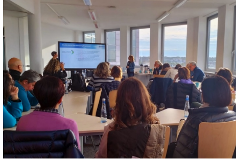
Eine italienische Delegation informierte sich an der UDE über die Lehrkräfteausbildung in NRW.