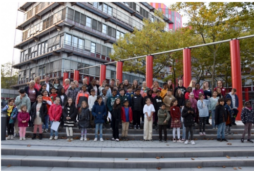
Die Mentees und Mentor*innen der 3. Kohorte wurden offiziell ins Programm aufgenommen.

Die Mentor*innen und Mentees der 3. Kohorte des Projekts WEICHENSTELLUNG für Viertklässler sind am 17. Oktober 2023 offiziell ins Programm gestartet. Rund 170 Gäste, darunter die Erziehungsberechtigten, Geschwister und Lehrkräfte der beteiligten Schulen, folgten der Einladung zur Auftaktfeier im Glaspavillon am Campus Essen.