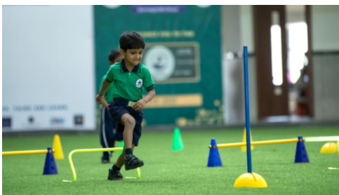
Mit digitalen Tools könnten die Bewegungsmuster dieses Jungen dokumentiert werden.

Die Digitalisierung bietet in der Schule zahlreiche neue Möglichkeiten der Unterrichtsgestaltung, birgt aber auch Herausforderungen. Lehrkräfte müssen digitalisierungsbezogene Kompetenzen erwerben, damit sie das didaktische Potenzial der digitalen Medien ganz ausschöpfen können. Unter der Konsortialführung der Universität Duisburg-Essen entwickeln die beiden Konsortien Communities of Practice Sport bzw. Arts (Com o Sport und Com o Arts) bis zum Frühjahr 2026 passende Aus- und Fortbildungskonzepte für Sport-, Kunst- und Musiklehrkräfte.