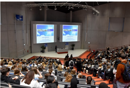
Viele Erstsemester-Studierende haben im Oktober ein Lehramtsstudium an der UDE begonnen.

Wie in jedem Jahr unterstützten Mitarbeiter*innen des ZLB die Studienanfänger*innen im Lehramt zu Beginn des Wintersemesters mit Informationsangeboten. Begleitend zu den Erstsemester-Begrüßungen informierte ein Team von ZLB-Mitarbeiter*innen und Hilfskräften die Erstis auf dem Infomarkt Studienstart am 02. Oktober 2023 des Akademischen Beratungszentrums im Glaspavillon.