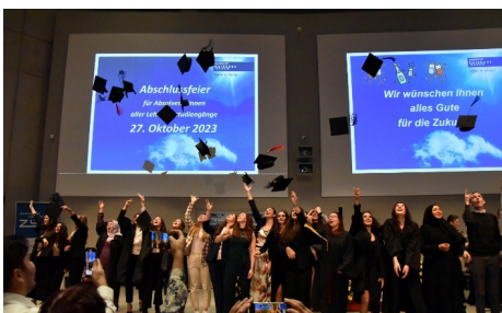
Am Ende flogen die Hüte: Wir gratulieren allen Absolvent*innen.

Insgesamt füllte sich der Saal mit knapp 700 Personen. Eingeladen hatte das Zentrum für Lehrkräftebildung (ZLB), das die Feier zweimal jährlich federführend mit Unterstützung durch das Prüfungswesen der UDE ausrichtet.