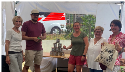
Das ZLB-Team bot Dosenwerfen am Stand an.

Am 20. Juni 2023 fand am Campus Duisburg bei herrlichem Sommerwetter das alljährliche Sommerfest der Universität Duisburg-Essen statt. Auch das Zentrum für Lehrkräftebildung (ZLB) war mit einem Stand vertreten, verteilte Infomaterial und kam mit den zahlreichen Besucher*innen ins Gespräch. Großen Spaß bereitete das Dosenwerfen, das am ZLB-Stand angeboten wurde.