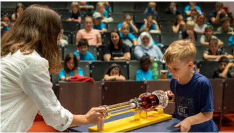
Bei den Kindervorlesungen „Unikids“ gab es viel zu lernen.

Kindervorlesungen. Kinder von 8 bis 12 Jahren hatten die Gelegenheit, etwas über berühmte Forscherinnen in den Naturwissenschaften oder König Artus und seine Tafelrunde zu lernen. Auch eine bunte Experimente-Show wurde vorgeführt.