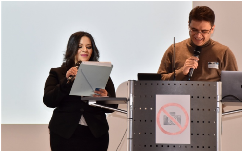
Die beiden Kurssprecher*innen gaben in ihrer Rede Einblicke in das Programm Lehrkräfte PLUS.

Teilnehmenden des nächsten Durchgangs. Zum ersten Mal seit dem Programmstart im August 2021 konnte die Zertifikatsverleihung in Präsenz stattfinden.