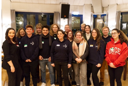
Erstmals hatten die Buddys und Mentees die Gelegenheit, sich zu vernetzen.

Am 16. November 2023 fand ein Get-Together zum Buddy-Programm Lehramt von talents4teachers/teachers4talents statt. Die Buddys und Mentees der Kohorte 2023/24 konnten bei der Auftaktveranstaltung im Café der BRÜCKE am Campus Essen zum ersten Mal die weiteren Buddys und Mentees treffen und sich in entspannter Atmosphäre über die eigene Kleingruppe hinaus austauschen und vernetzen. Es gab ein lockeres