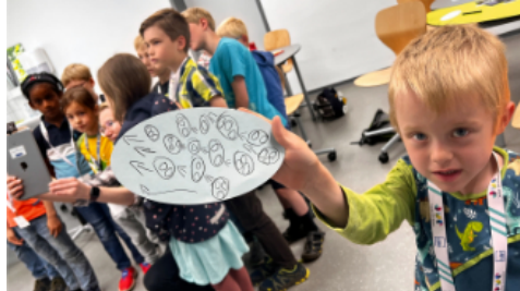
Die jungen Studierenden waren mit Begeisterung dabei.