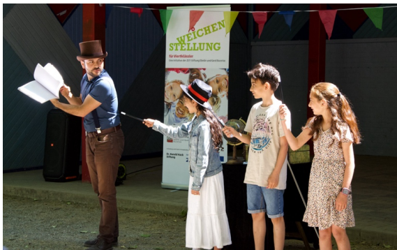
Zauberer Mister Magic unterhielt die Kinder.

Mit einem Sommerfest im Essener Grugapark ließen am 03. Juni 2023 etwa 200 Gäste das 4. Schuljahr der 2. Kohorte im Mentoring-Programm WEICHENSTELLUNG für Viertklässler an der Universität Duisburg-Essen (UDE) ausklingen. Bei strahlendem Sonnenschein kamen neben den Mentees und deren Erziehungsberechtigten und Geschwistern auch Mentor*innen, Lehrkräfte