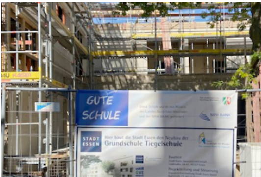
Der Neubau der Schule macht gute Fortschritte.

Vor dem Hintergrund des sichtbaren Fortschritts des Schulbaus fand am 26. September 2023 erneut eine Sitzung der Offenen AG „Unischule“ statt. Gemeinsam mit einer Vertreterin der Grundstücksverwaltung der Stadt Essen gab die verantwortliche Architektin einen umfassenden Einblick in den aktuellen Stand des Bauvorhabens. So konnten sich die Teilnehmenden aus den verschiedenen Fakultäten der Universität Duisburg-Essen sowie