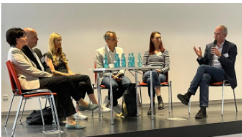
Auch eine Podiumsdiskussion war Teil der Tagung.

Am 02. Juni 2023 fand im Rahmen des Projekts Professionalisierung für Vielfalt (ProViel) die Abschlussstagung des Handlungsfelds CaseLabs statt. Es hat unterschiedliche videogestützte Lehr- und Lern-Formate zu angeleiteter und eigenverantwortlicher Fallarbeit in der Lehrkräftebildung entwickelt. Im Dialog zwischen Wissenschaft und Praxis wurden die Ergebnisse der drei Teilprojekte Kollegiale Unterrichtsreflexion in reFLECTing Teams (FLECTT)